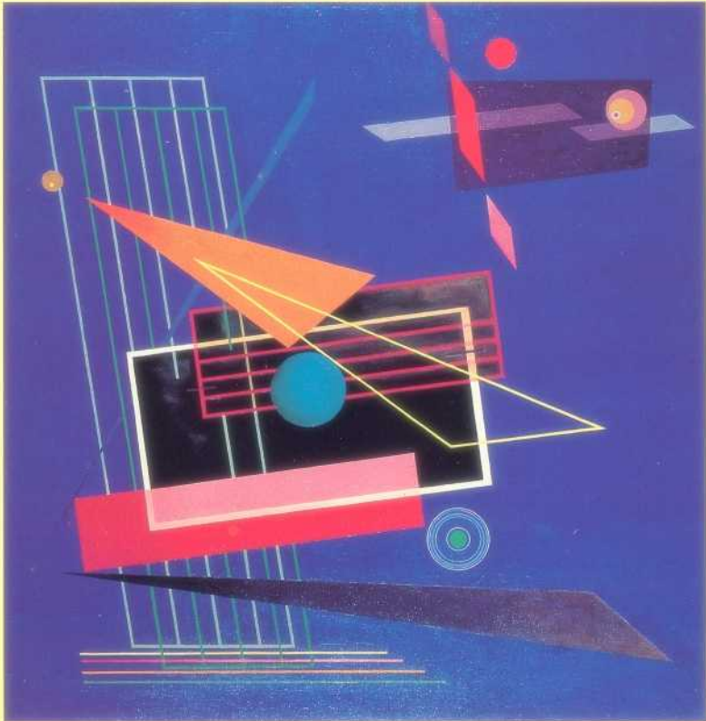
Agitato , 1943 oil on canvas