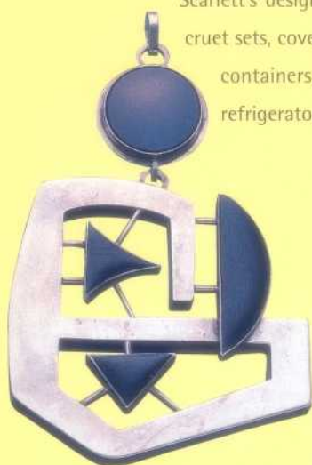
Pendant, 1964 silver with onyx and ebony Collection of Sandra and Samuel Esses

Scarlett's designs include salt and pepper shakers, cruet sets, covered containers, barware, poker chip containers, bathroom scales, kitchen ranges, refrigerators, sofas, suites of furniture, built-in